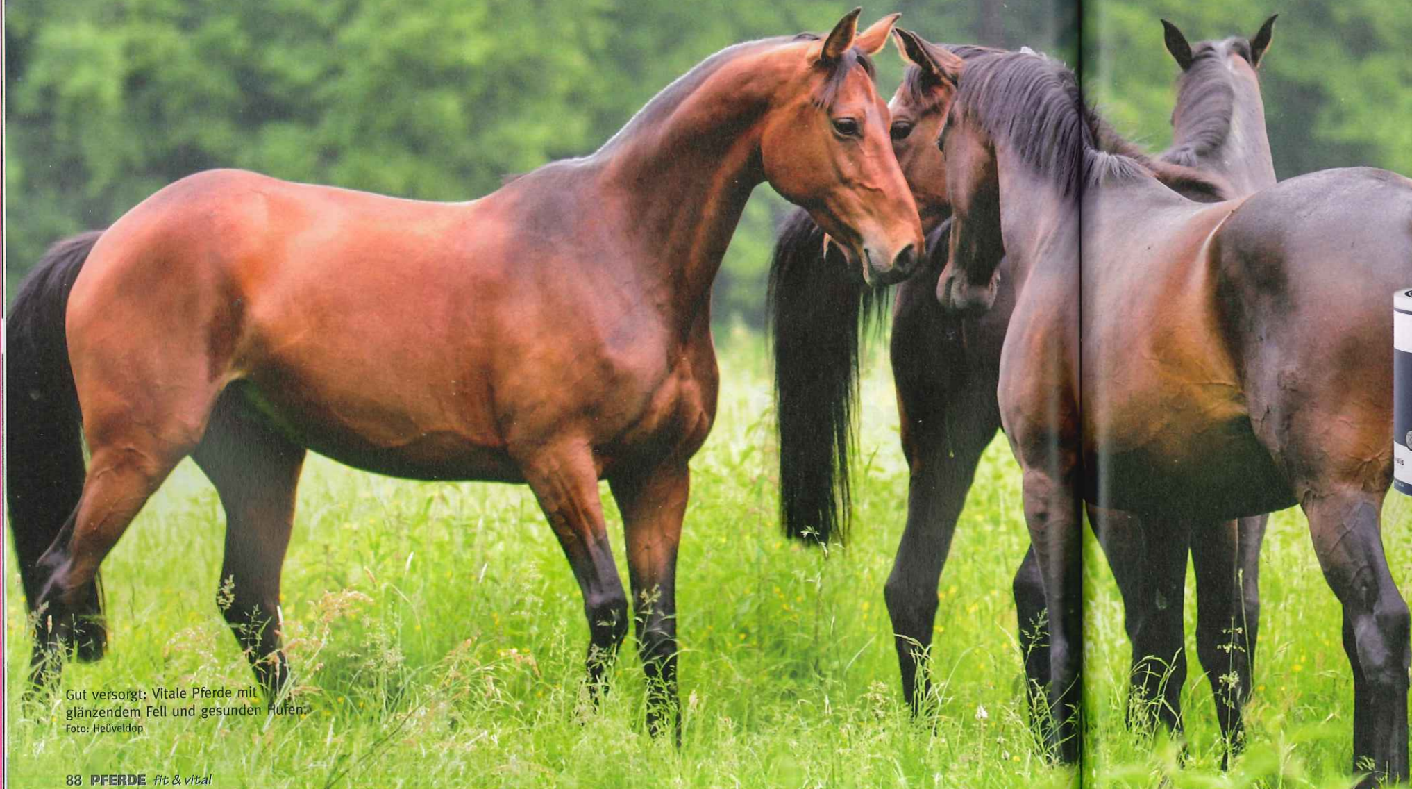
Gut versorgt: Vitale Pferde mit glänzendem Fell und gesunden Hufen.